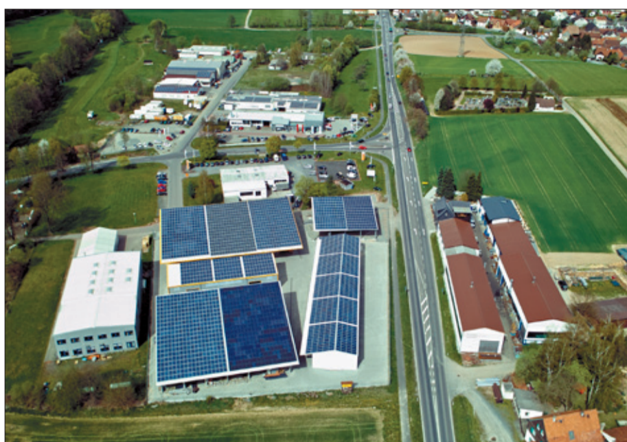
Das Fimengelände mit insgesamt 8000 qm besteht aus fünf Hallen mit 4700 qm Nutzfläche. Dies bietet Platz für den kompletten Fuhrpark, ein Hochregallager, Werkstätten und die Verwaltung.